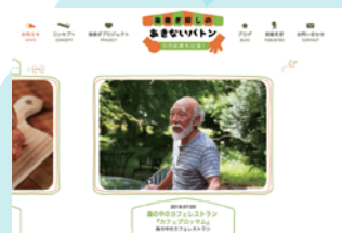
後継ぎ探しのあきないバトン web サイト

事業承継デザイナー／司法書士 ひょうごエンジン株式会社代表取締役 公益財団法人神戸市産業振興財団 「100年経営支援事業総括アドバイザー」